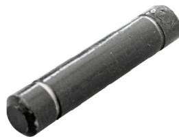
BlueLift Lagerbolzen 12x60 mm, mit 2 Nuten