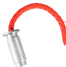
BlueLift Arretierbolzen für Höhenverstellung verzinkt Zn12/A DIN 50961