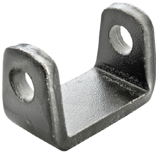
BlueLift Aufnahmebügel Dachverbindung

Mit dem Liftplus ist es nun möglich, die Aufbauhöhe 7-stufig um max. 175 mm zu verstellen.