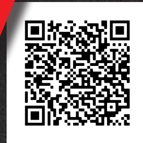
Ladungssicherung 2020 Katalog